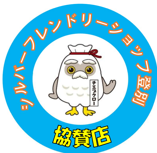
協賛店に配布するステッカー